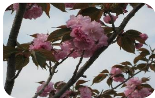
八重桜も咲きました