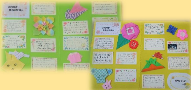
在宅で参加いただいた作品