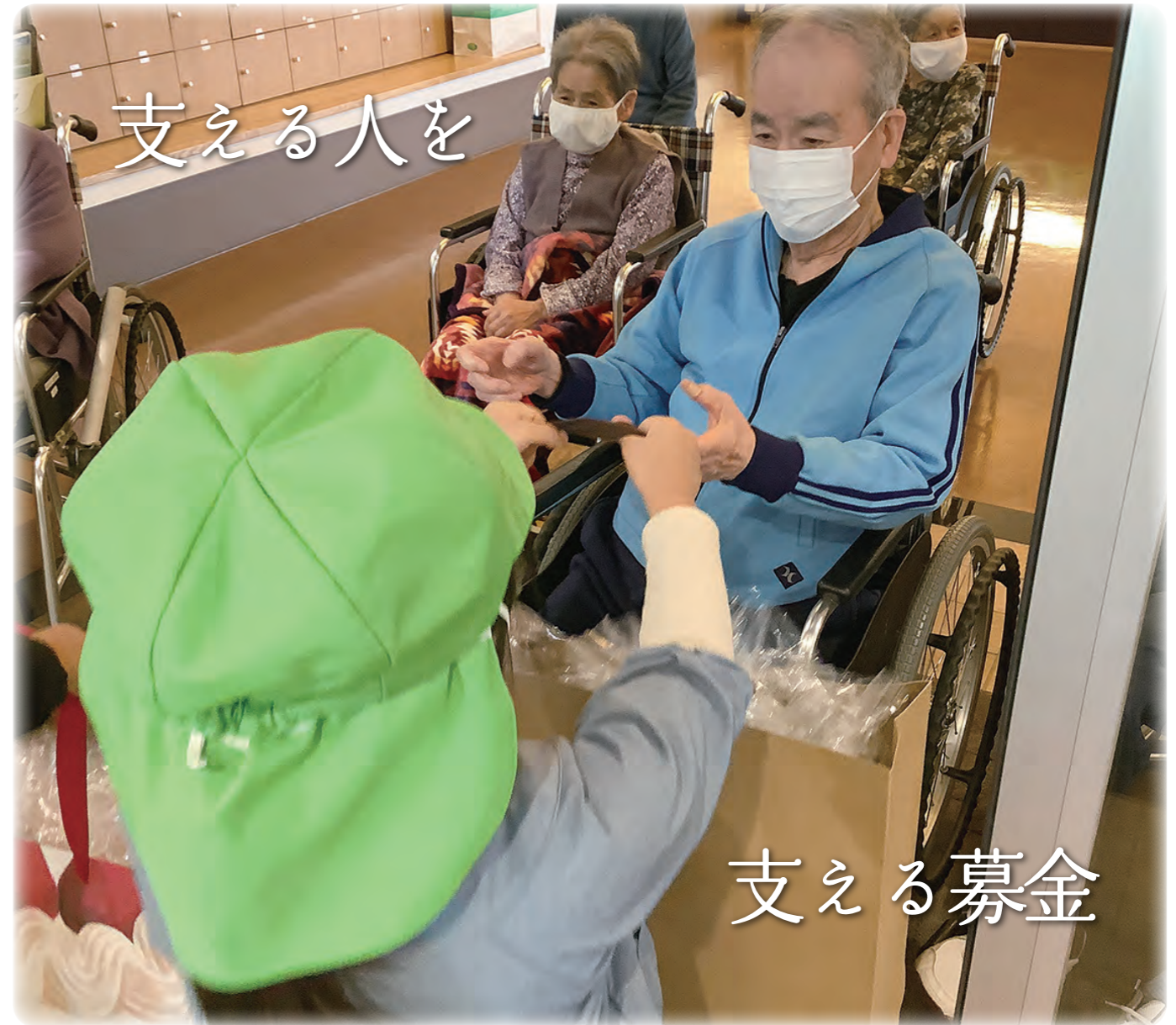
地域ふれあい事業(八街市)