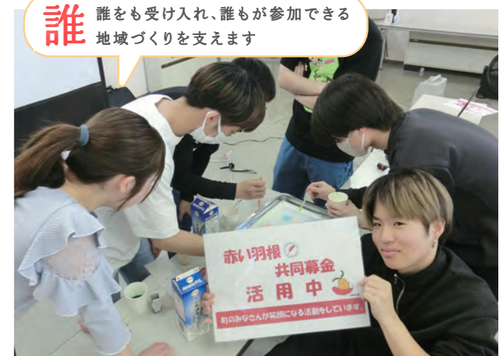
春休みボランティア体験~科学実験教室~(野田市)