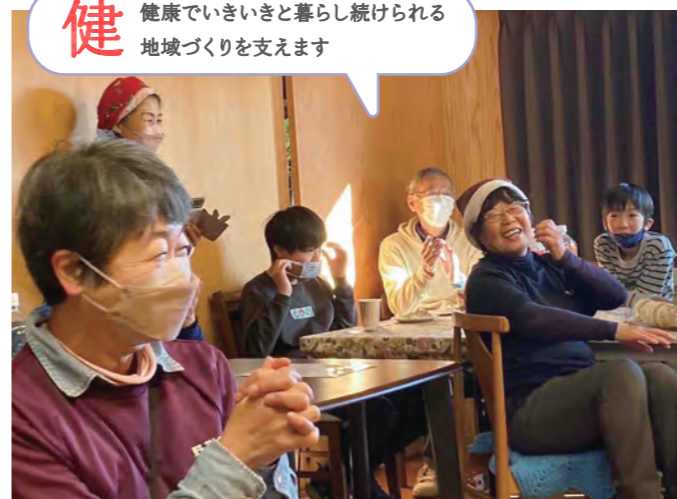
児童デイサービスクリスマス会(山武市)