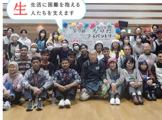
フードパントリー(成田市)