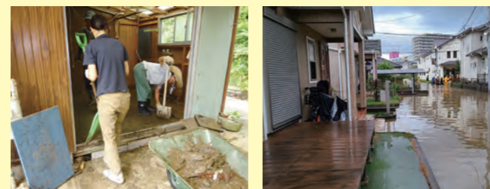
令和5年9月の台風15号接近による大雨災害復興支援