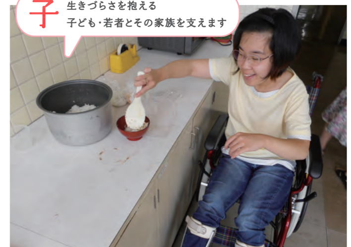
自立生活支援<体験実習>(千葉市)