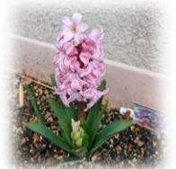
ヒヤシンスの花が咲きました