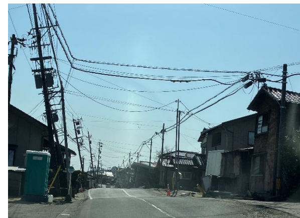
令和6年1月の能登半島地震で 液状化の被害を受けた石川県内灘町

災害ボランティアセンターは、被災者・被災地を主体にボランティアの協力を得て、地域の復興や支援のための役割を担い、災害ボランティア活動を円滑に進めるための拠点です。