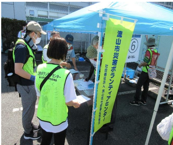
災害ボランティアセンターの運営訓練